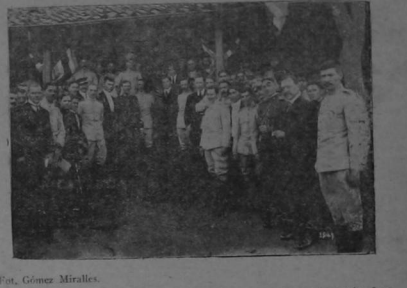
Esta fotografía fue tomada cuando después de terminado el almuerzo uno de los soldados de la guarnición del Cuartel ejecutó algunas pruebas de presidigitación ante el señor Jefe Provisorio.